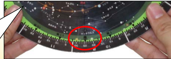
南の空を観察する場合