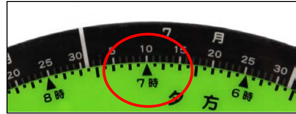
7月10日午後7時の場合

①時刻目盛りを回転させて、観察したい月日、時刻に も 月日の目盛りと時刻の目盛りを合わせる。