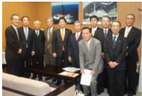
鈴木 寛 文部科学副大臣室にて（2010.12.10.）